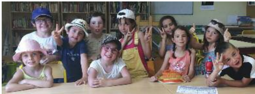
Reprise du périscolaire deux heures hebdomadaires pour cette nouvelle année