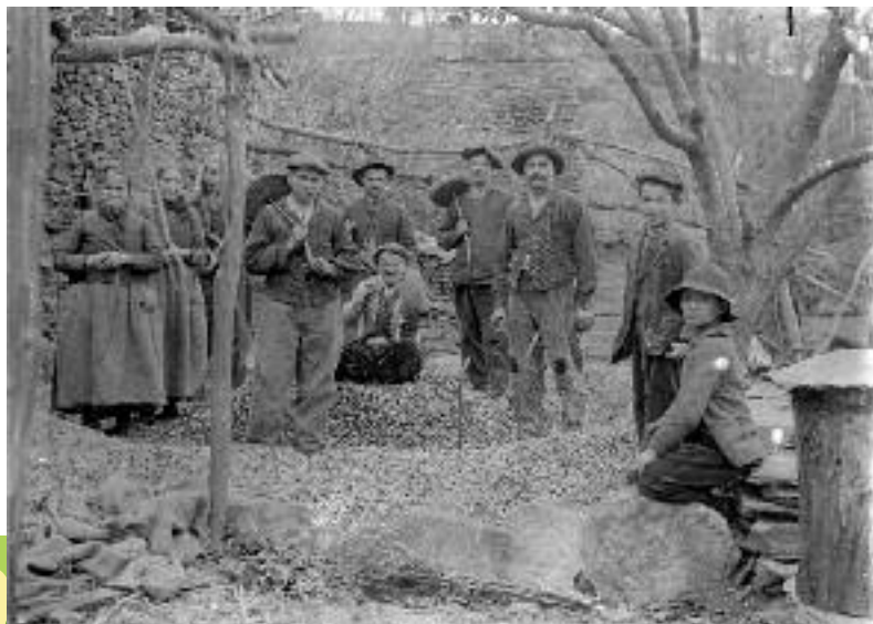
Récolte des châtaignes en 1910-1930

rains escarpés. La cochonnaille, au demeurant délicieuse, qui pendait au plafond de la cuisine, complétait le repas.