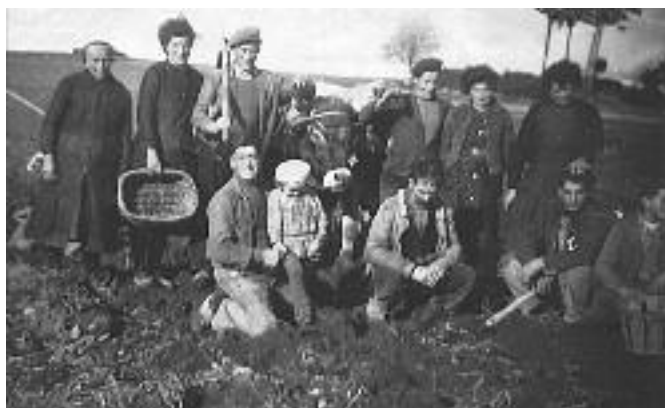
Ramassage de pommes de terre en 1941 à Pigeyses

C'était au mois d'octobre, en général, que cette récolte pouvait commencer. En effet, semés tardivement fin mai à cause des gelées possibles à cette altitude (plus de mille mètres) les plants tardaient à mûrir. Chaque saison amenait ses types de travaux. Profitant d'une belle journée d'automne, chacun s'affairait sur tout le territoire de la commune et d'ailleurs, car il y avait des terres encore plus hautes dans les parages du Mézenc et sur les monts d'Ardèche tout proches. Le travail était relativement pénible et cassant pour le dos, à piocher toute la journée.