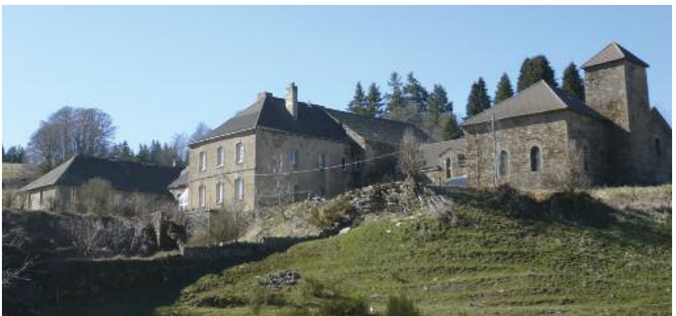
L'abbaye de Mercoire

Pierre Malaval, à bout de souffle, ne s'était pas réfugié chez ses pa-